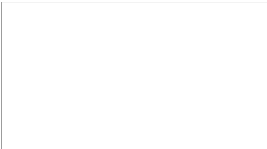
แผนภูมิแสดงข้อมูลเชิงสถิติการให้บริการทะเบียนหนังสือรับ-ส่ง